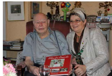
Internett-Bilde: Fra 90-årsdagen.

I dag står Nannestad Bygdemuseum som en kulturinstitusjon i bygda. Der vises gamle håndverk og der kan ung og gammel se dr. Habberstads kontor og Størdals butikk. Det er skiftende temautstillinger som viser ulike sider av historien og ved livet i bygda.