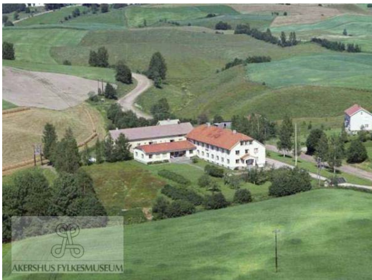
Nannestad Alderspensionat, 30/07-1964