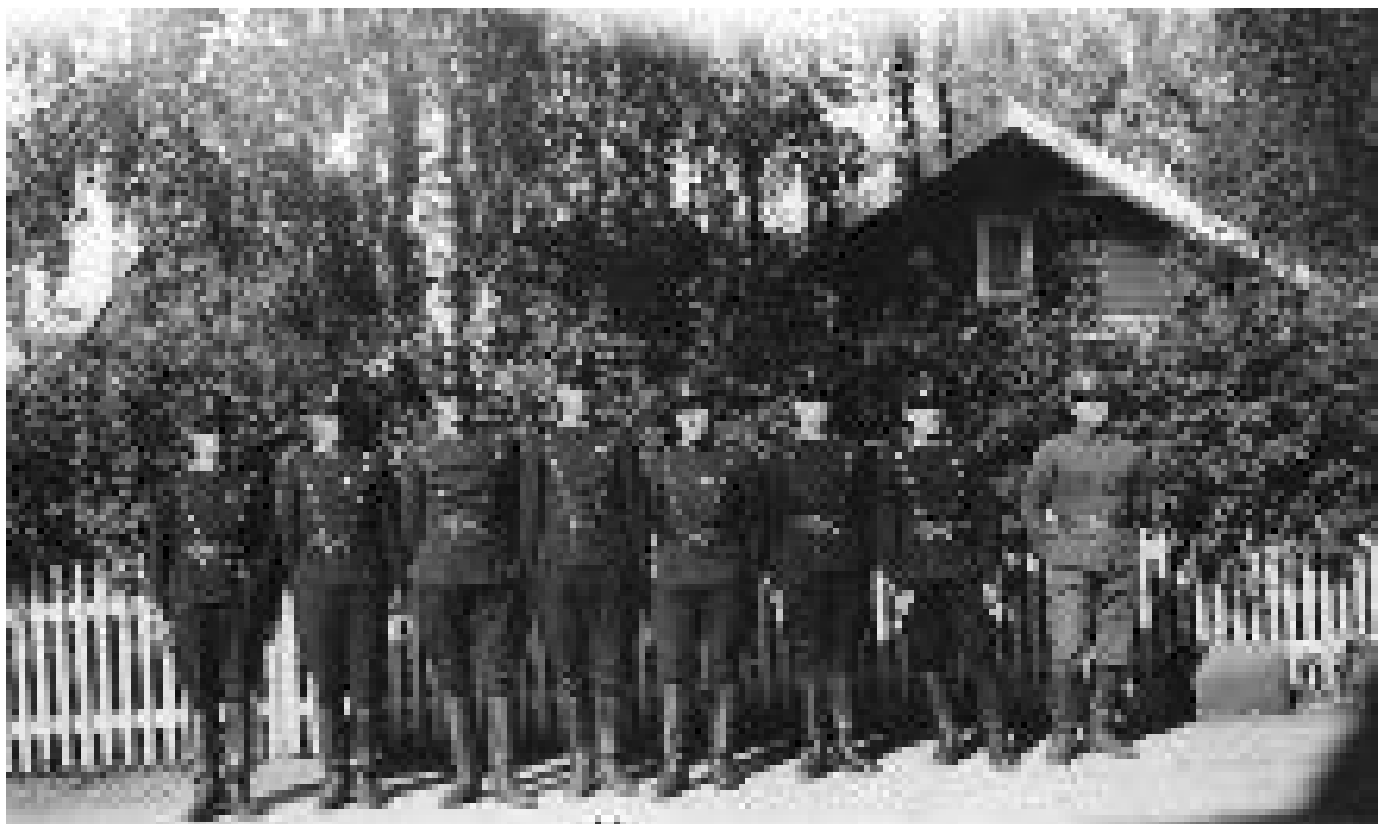
Dragoner på Gardermoen, 1936