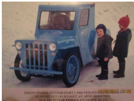
Ved Lima påsken 1966.