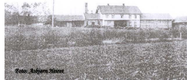
Holter meieri. Postkort fra 1913

Andelshavere fikk også mange forpliktelser. Det måtte graves is-kjeller og skaffes is. 80 lass ble saget på Harstad tjernet og kjørt. Dessuten måtte det også mye sagflis til. Ved i store mengder måtte kjøres. De forpliktet seg også til å kjøre meieriprodukter til Kristiania, med unntak av april og mai da varene ble kjørt til Trøgstad stasjon. Bestyrer og regnskapsfører ble ansatt, og det ble nok produsert gode oster, for meieriet fikk flere diplomer og medaljer for dette de første årene. Disse diplomene og medaljene er vi i historielaget på jakt etter. For trygg oppbevaring, vi vet at de finnes.