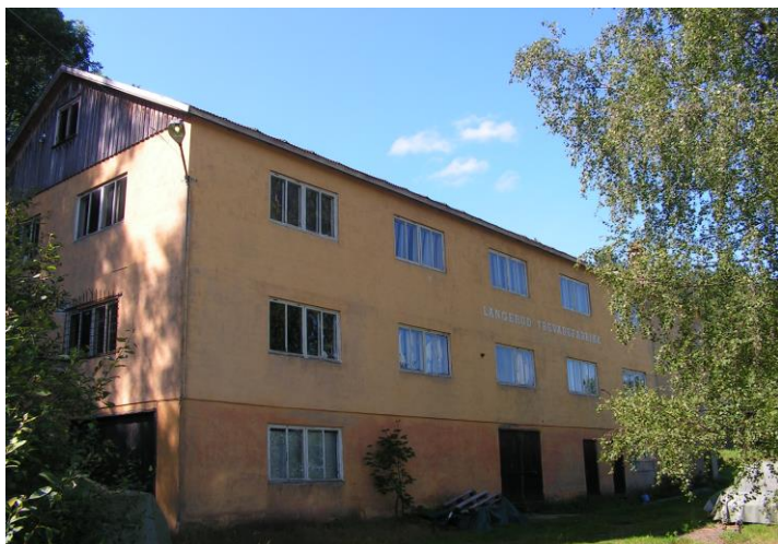
4 Langerud Travarefabrikk