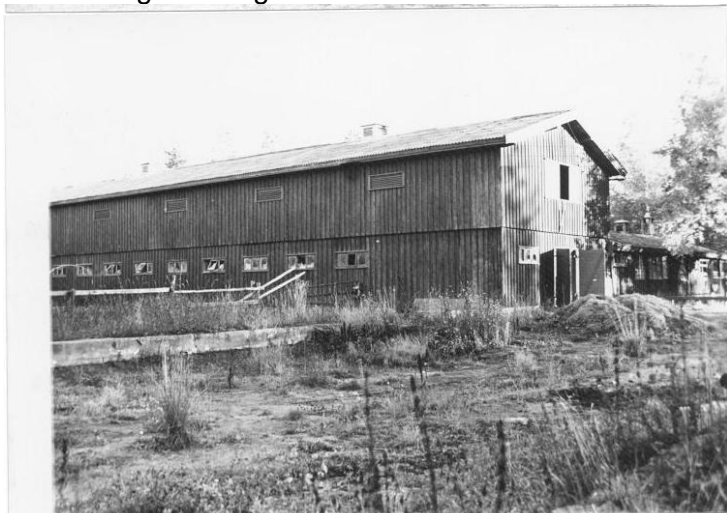
6 Stall-bygningen på Mohøgda

I mange år hadde DNOR latt en befalingsmann bo i huset for å føre tilsyn med dette, men denne ordningen opphørte i 1977. Etter dette ble det vanskelig å beskytte huset mot innbrudd og hærverk, og det ble i 1979 overlatt til en arkitekt for nedrivning og fjerning. Sommerstallen ble kort tid etter også revet. Huset er i dag gjenreist og i bruk som hovedbygning på Håkåstad gård i Vågåmo.