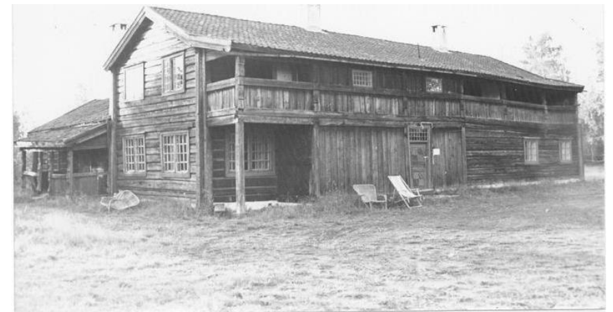
Klubbhuset på Mohøgda