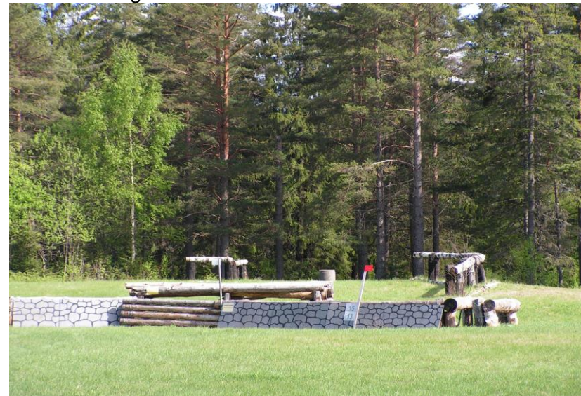
Litt av hinderbanen ved Flatner

De Norske Officerers Rideklub ble stiftet 24. august 1880. De første årene hadde klubben ridebane sør for intendanturleiren på Gardermoen. Under krigen ble denne beslaglagt av tyskerne. Etter krigen ble det derfor anlagt ny bane, denne gangen ved Flatnertjern. Banen ble åpnet med ridestevne 26. juni 1954. Sommeren 1958 ble det bygget et hinderskur i skråningen opp mot Mohøgda. Det ble bygget slik at det også kunne brukes som sommerstall. Et voldsomt løft skjedde i 1965, da det meste av Nordisk Ryttermesterskap i feltridning ble avviklet på Flatner. Da inngikk også klubbens hus på Mohøgda, som administrasjons-lokale og bespisningssted for gjester. Premieutdelinger ble foretatt fra den muren som fortsatt står på Øvre Mohøgda. Dressurbanen i sydenden av galoppsporet ble anlagt til dette stevnet. Det er nå galoppbane, feltrittbane, hinderbane og dressurbane ved Flatner.